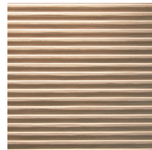
Eiche hell Alpi Furnier