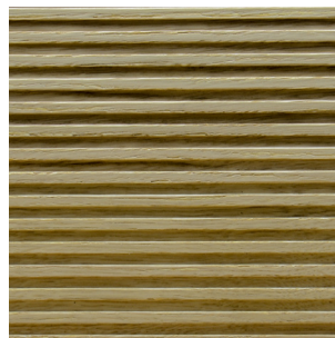
Asteiche Echtholz furnier