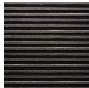
Schwarz Alpi Furnier